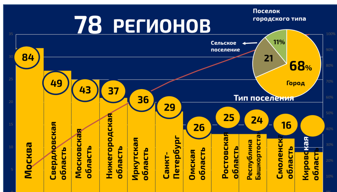
Рис. 4. Характеристика территорий, участвовавших в опросе

Самую обширную группу педагогов, участвующих в опросе, составили воспитатели (54%) с высшим образованием (67%) в возрасте 45–54 лет (41%).