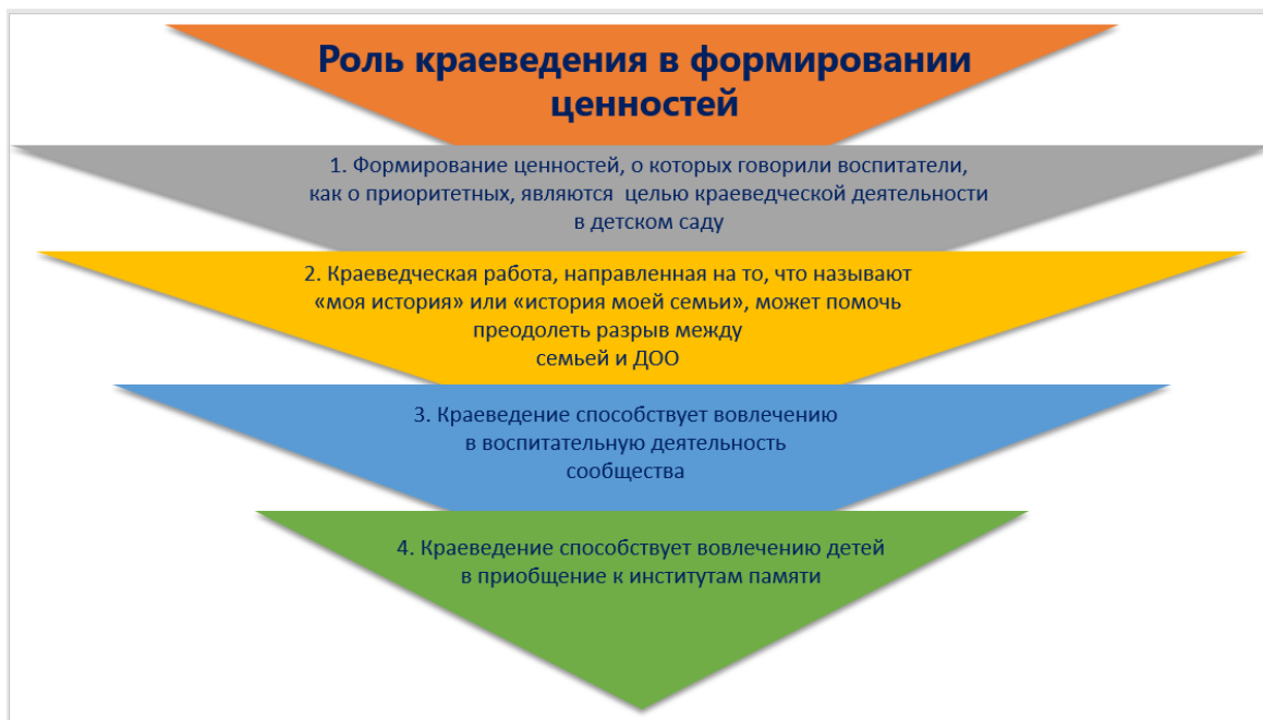
Рис. 8. Роль краеведения в формировании ценностей в детском саду

Краеведение способствует вовлечению сообщества в деятельность детского сада. Почему? Потому что многие ресурсы, которые нас окружают, и многие ценности, распространенные на каждой территории, носителями которых являются сообщества.