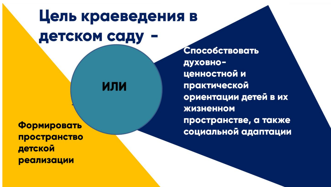
Рис. 2. Цель краеведения в детском саду

Какова же цель краеведения в детском саду? Публикаций, подготовленных учеными, писателями, краеведами, педагогами, воспитателями, сегодня очень много. В методический и научный оборот вводится лавина материалов, однако, несмотря на наличие ФОП ДО [6], эти объемы не систематизированы.