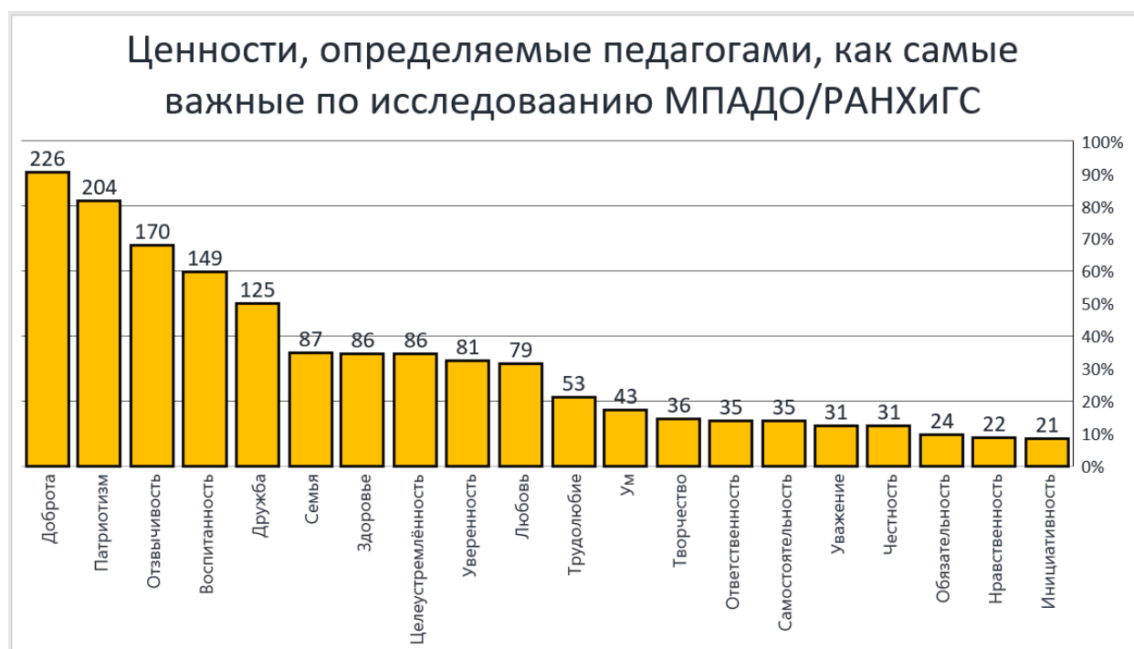
Рис. 6. Ценности, которые, по мнению воспитателей, являются самыми важными для воспитания дошкольников