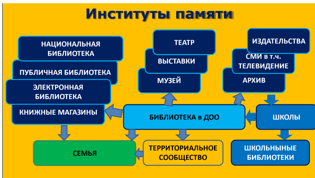
Рис. 9. Институты памяти в пространстве образовательных организаций

«Институты памяти» – термин, которому дали жизнь технологии и потребность в оцифровке. Сегодня этот термин широко распространен, описывает учреждения, которые являются хранителями культурного наследия. Краеведение в этом случае помогает преодолеть еще один исторически случившийся разрыв между тем, что все образовательные ресурсы управляются Министерством культуры, а все пользователи – Министерством просвещения.