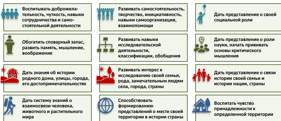
Рис. 3. Задачи краеведения в детском саду учетом таких направлений, как развитие личности, развитие интереса к науке, развитие представлений о богатстве территории, на которой располагается детский сад, воспитание любви к родному краю.

Цвет значков соответствуют цвету ленточек на рис. 1