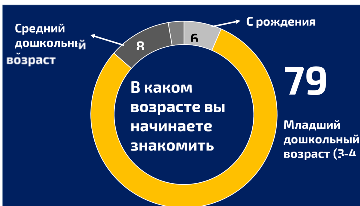
Рис. 5. В каком возрасте вы начинаете знакомить детей с ценностями

Основная часть опрошенных педагогов считают, что знакомство с ценностями должно начинаться с младшего дошкольного возраста, то есть с трех лет. Это проверено почти столетней практикой, так как воспитательная работа осуществлялась в детских садах неразрывно с обучением, начиная с конца XIX века. И за этот период была накоплена большая методическая база, до сих пор не оцененная.