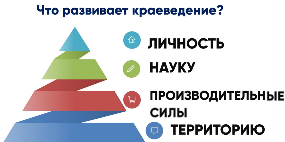
Рис. 1. Схема влияния краеведения на развитие окружающего мира

Когда мы говорим о краеведении применительно к младшему возрасту, мы очень мало задумываемся, что под этим подразумевается. Понятно, что речь идет о родном крае. Однако то внимание, которое сегодня уделяется краеведению, объясняется тем, что его влияние в детском саду гораздо глубже: краеведение способствует развитию личности, науки, производительных сил и, наконец, территории.